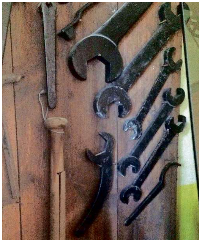
Auch die alte Werkzeugleiste ist erhalten.